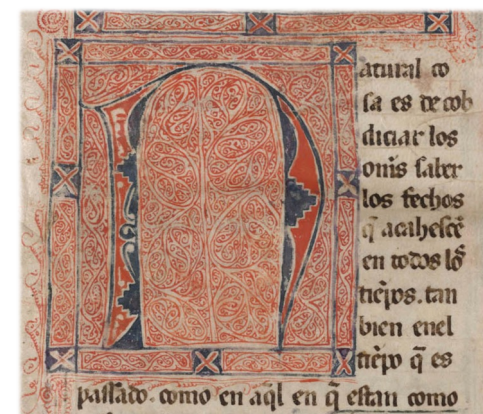
General Estoria, I, BNE, MSS/816, f. 1r.