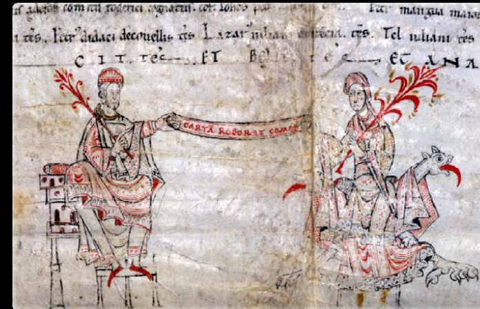
Carta de arras del conde Rodrigo Martínez a Urraca Fernández (1129). Archivo Catedral de Valladolid